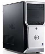
予約サーバ ワークステーションPC

Web予約用にブロードバンド回線「NTT フレッツ光」をご用意いただけます。 また、固定IPサービス付きプロバイダのご契約が必要となります。月額1,260円